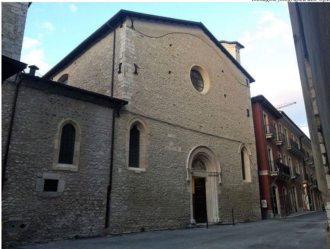
Immagine fotografica dell'Opera d'Arte